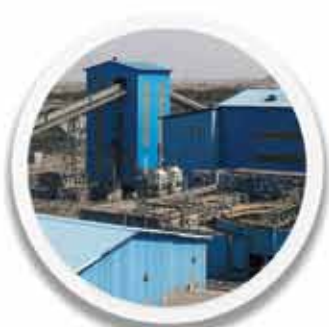
کارخانه خط ۴ فرآوری ۲۶۱,۴۳۸ تن