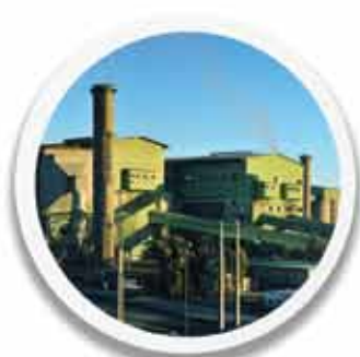
کارخانه خطوط ۱ تا ۳ فرآوری ۶۴۲,۴۱۰ تن