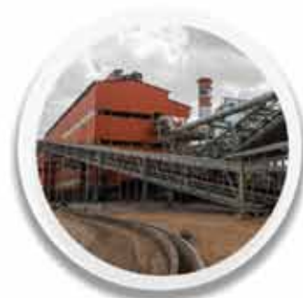
کارخانه گندله سازی ۵۴۷,۸۰۴ تن