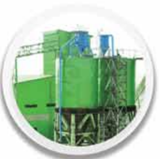
کارخانه فرآوری غبار ۹۶,۷۰۴ تن