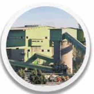
مجموع تولیدکنسانتره شرکت ۱,۶۴۴,۴۵۰ تن