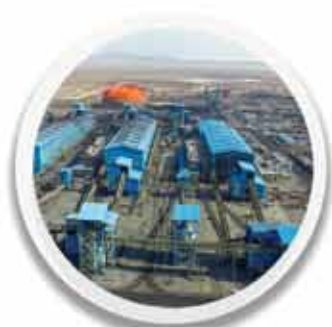
کارخانه خطوط ۷ تا ۵ فرآوری ۶۴۳,۸۹۸ تن